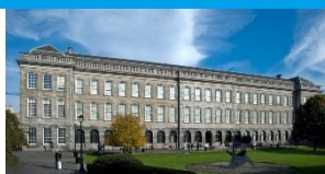
Stará knižnica Trinity