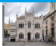
Real Gabinete Portugues