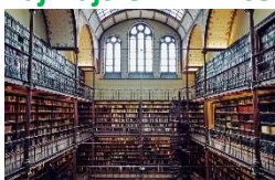
Vedecká knižnica Rijksmuseum