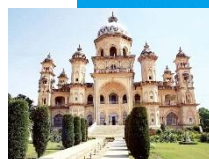
Rampur Raza Library