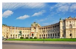
Národná knižnica Viedeň