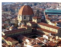
Biblioteca Medicea Laurenziana