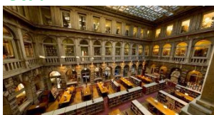
Národná knižnica sv. Marka