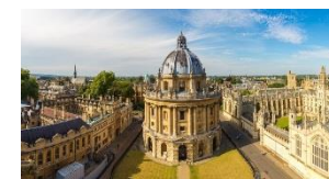
Knižnica v Oxforde