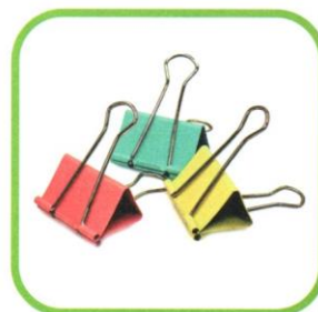
KLIPSY DO PAPIERU