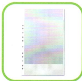
KOSZULKI NA DOKUMENTY