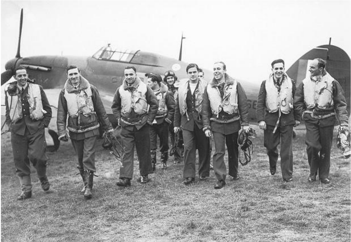
Piloci polskiego Dywizjonu 303