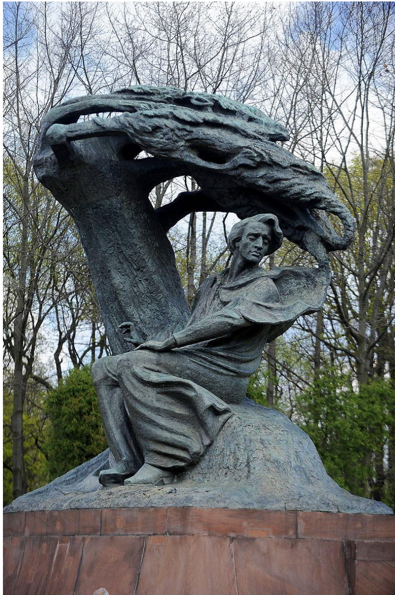
autorstwo C. Piwowarski

Zapraszamy do namalowania swoich wrażeń z wysłuchanej muzyki. Potrzebne będą farby i ... palce. Malujemy za pomocą barwnych plam powstałych przez maczanie palców w rozrobionej farbie i odbijanie ich na kartce.